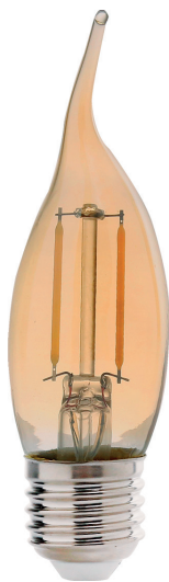
Vela Chama E27