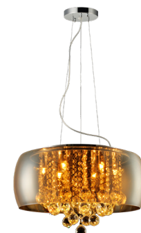
340557103 Wessex Ø500