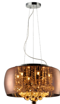
340545506 Wessex Ø500