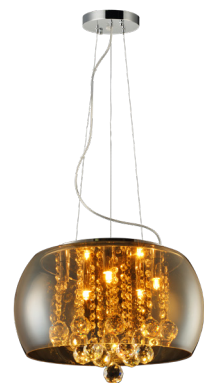
340527106 Wessex Ø400