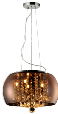
340515509 Wessex Ø400