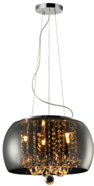
340504602 Wessex Ø400