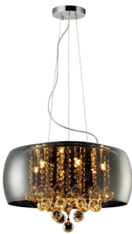
340534609 Wessex Ø500